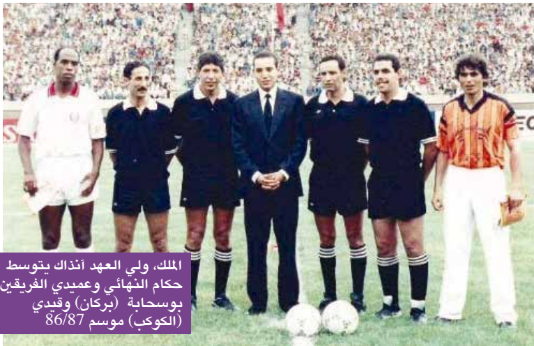
الملك، ولي العهد آنذاك يتوسط حكام النهائي وعميدي الفريقين بوسحابة (بركان) وقبدي (الكوكب) موسم 86/87